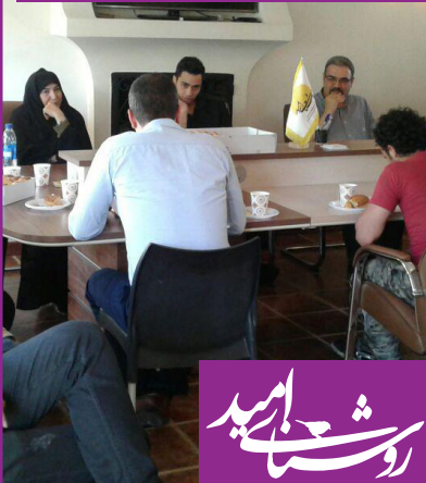
مراسم اهدای جوایز برندگان مسابقه یادداشت نویسی به مناسبت روز جوان