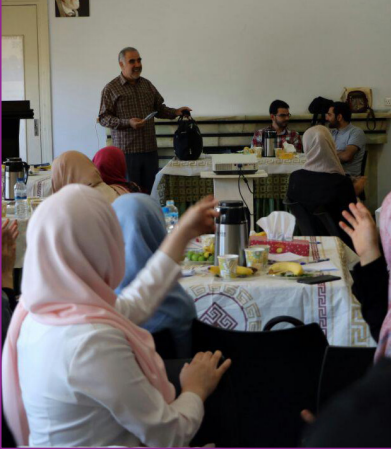
برگزاری کارگاه توانمندسازی برای فرزندان روشنی امید