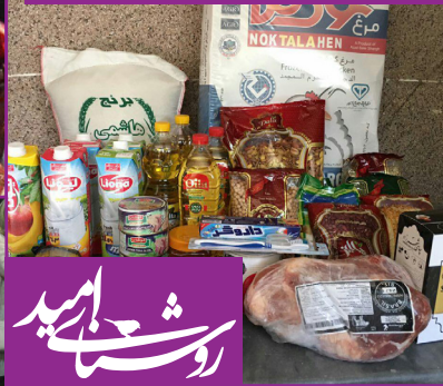
بسته های ارزاق ماه رمضان