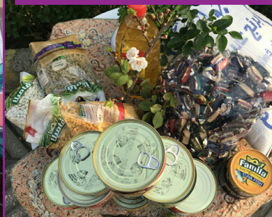
ارزاق نوروز ۱۳۹۶