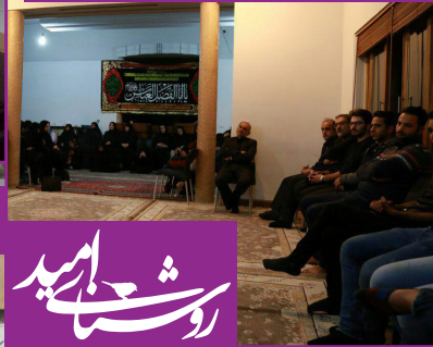
مراسم اربعین امام حسین (ع) برای فرزندان و خیرین روشنای امید