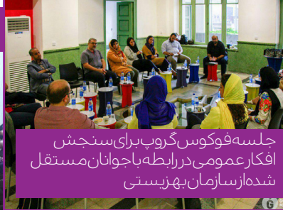
جلسه فوکوس گروپ برای سنجش افکار عمومی در رابطه با جوانان مستقل شده از سازمان بهزیستی