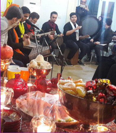
جشن شب یلدا برای فرزندان روشنای امید