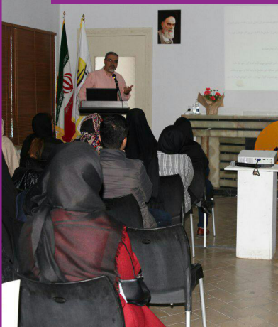
نشست فرهنگ‌کار داوطلبانه برای داوطلبان روشنی‌امید