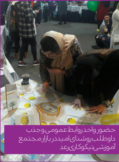
حضور واحد روابط عمومی و جذب داوطلب روشنای امید در بازار مجتمع آموزشی نیکوکاری رعد