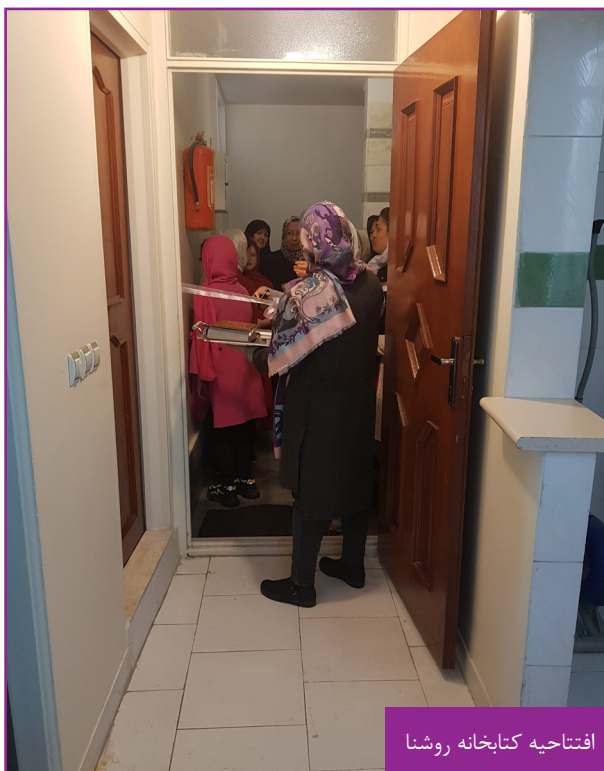
افتتاحیه کتابخانه روشنا