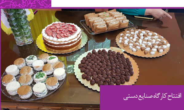
افتتاح کارگاه صنایع دستی