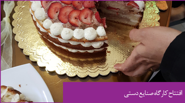
افتتاح کارگاه صنایع دستی