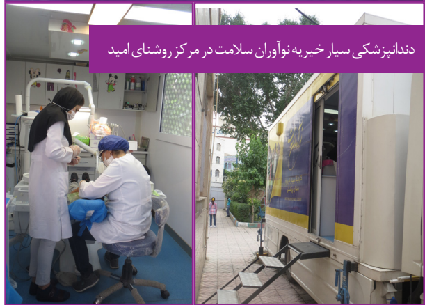
دندانپزشکی سیار خیره نوآوران سلامت در مرکز روشنی امید