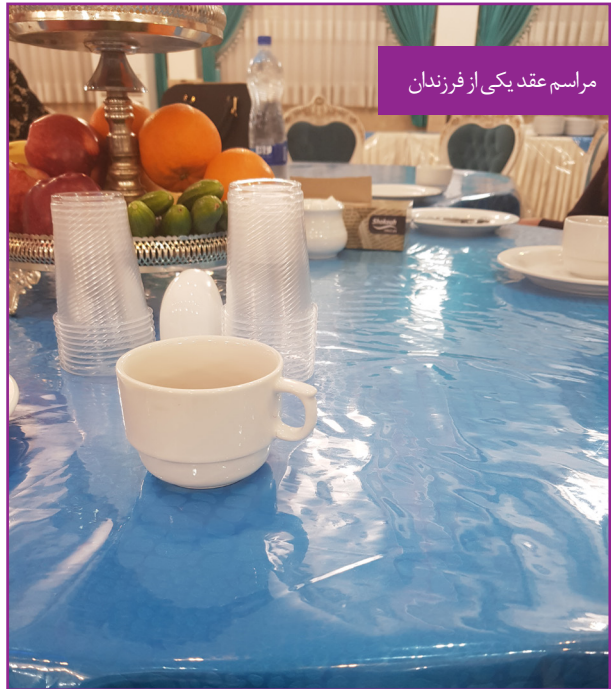
مراسم عقد یکی از فرزندان